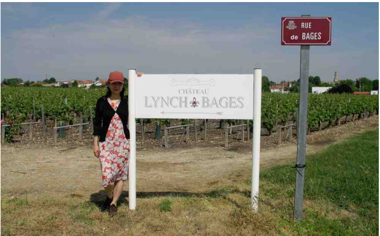
筆者到訪港人稱靚次伯 Chateau Lynch Bages。

其實，很多頂級酒莊都非常歡迎顧客參觀，每年在農閒的月份，都會接受探訪預約，幾年前筆者仍未開始學習葡萄酒，就曾經成功約訪數家波爾多頂級酒莊，到訪了包括 Chateau Margaux, Chateau Haut-Brion 及關連的 Chateau La Mission Haut-Brion, 以及港人較為熟悉的五級莊 Chateau Lynch Bages。