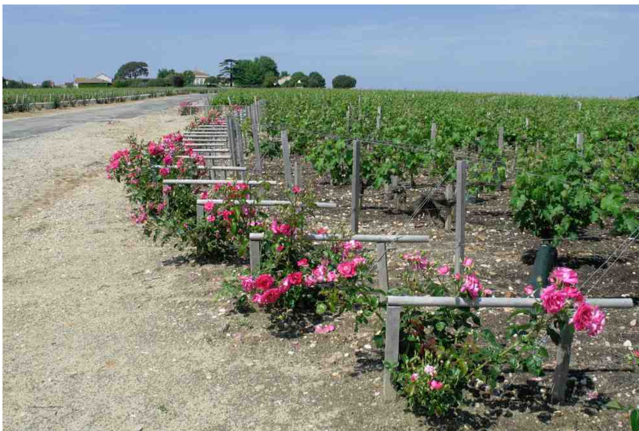
在葡萄藤蔓前種植玫瑰花，是波爾多的傳統做法，以預示有蟲害或傳染病發生。

好景不常，2003 年這級別再度評級時，有不少酒莊被除名，他們當中人入稟法院控告評審不公，導致 2003 年的評級被宣布無效。2008 年，當局重訂評審標準，由評審團巡視酒莊及品嚐產品後，決定酒莊是否符合資格，左岸的評級爭拗才得以平息。