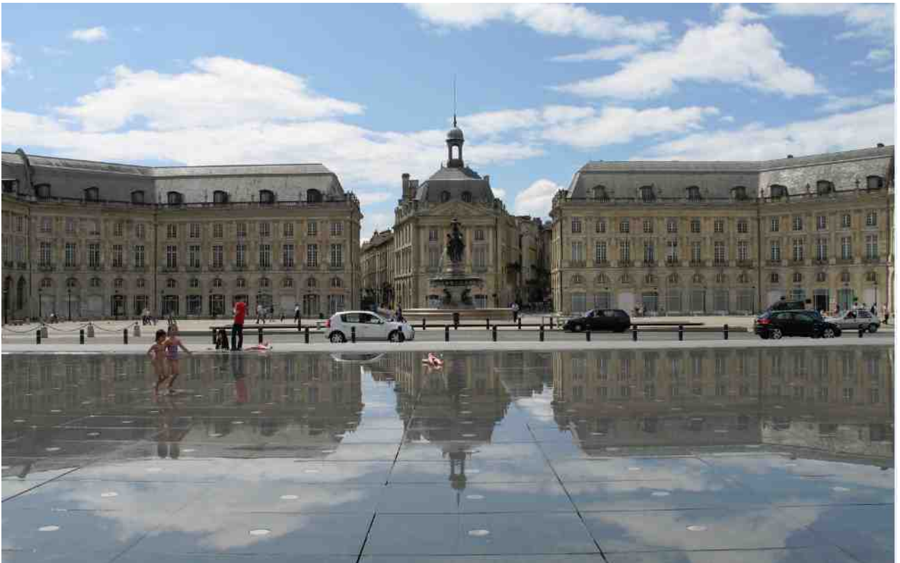
波爾多市中心有一個水深很淺的噴水池，長期有倒影被當地人稱為鏡子。