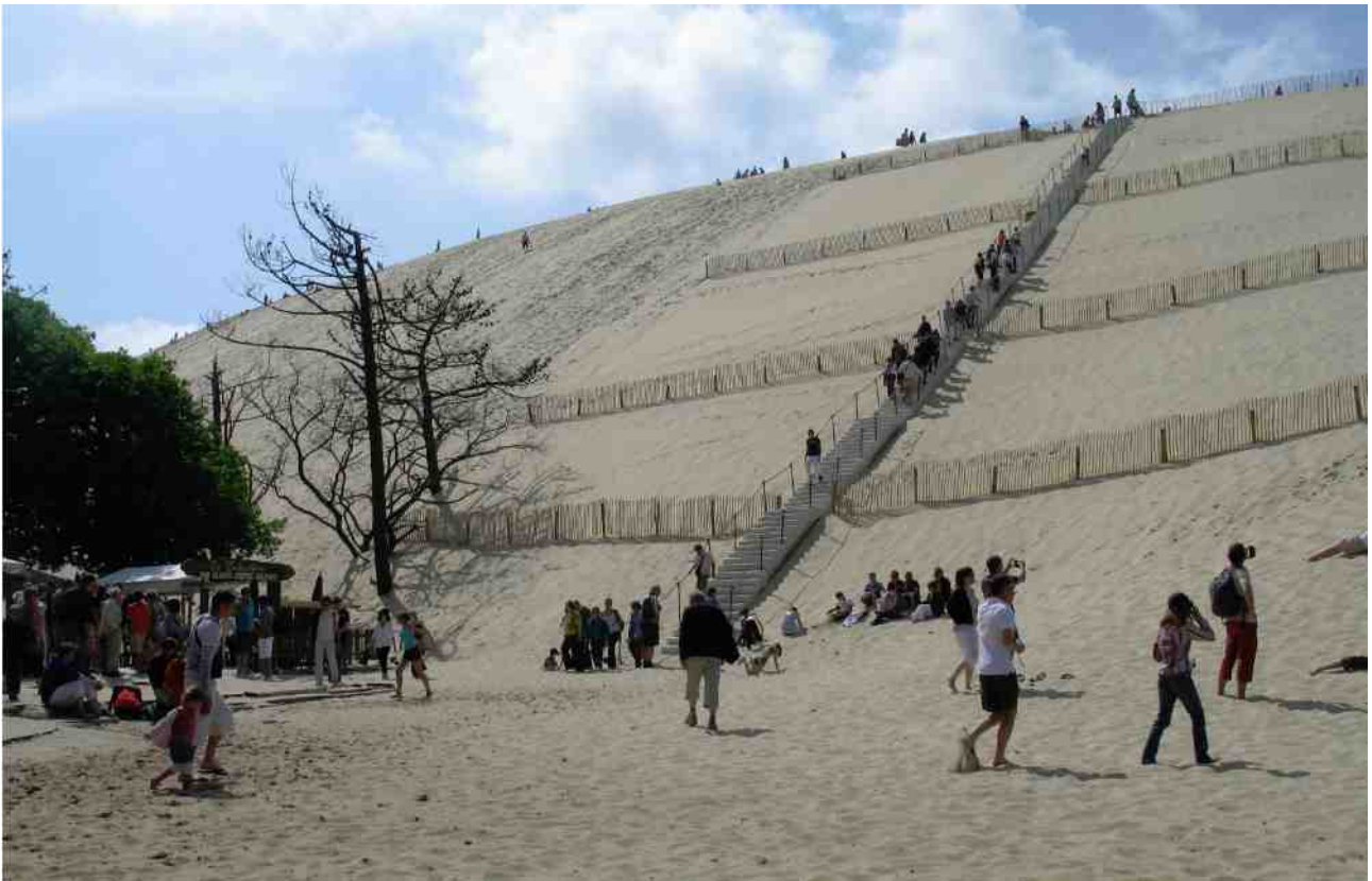
Arachon 海岸區的沙坵地帶，為波爾多阻隔部份雨水及強風。