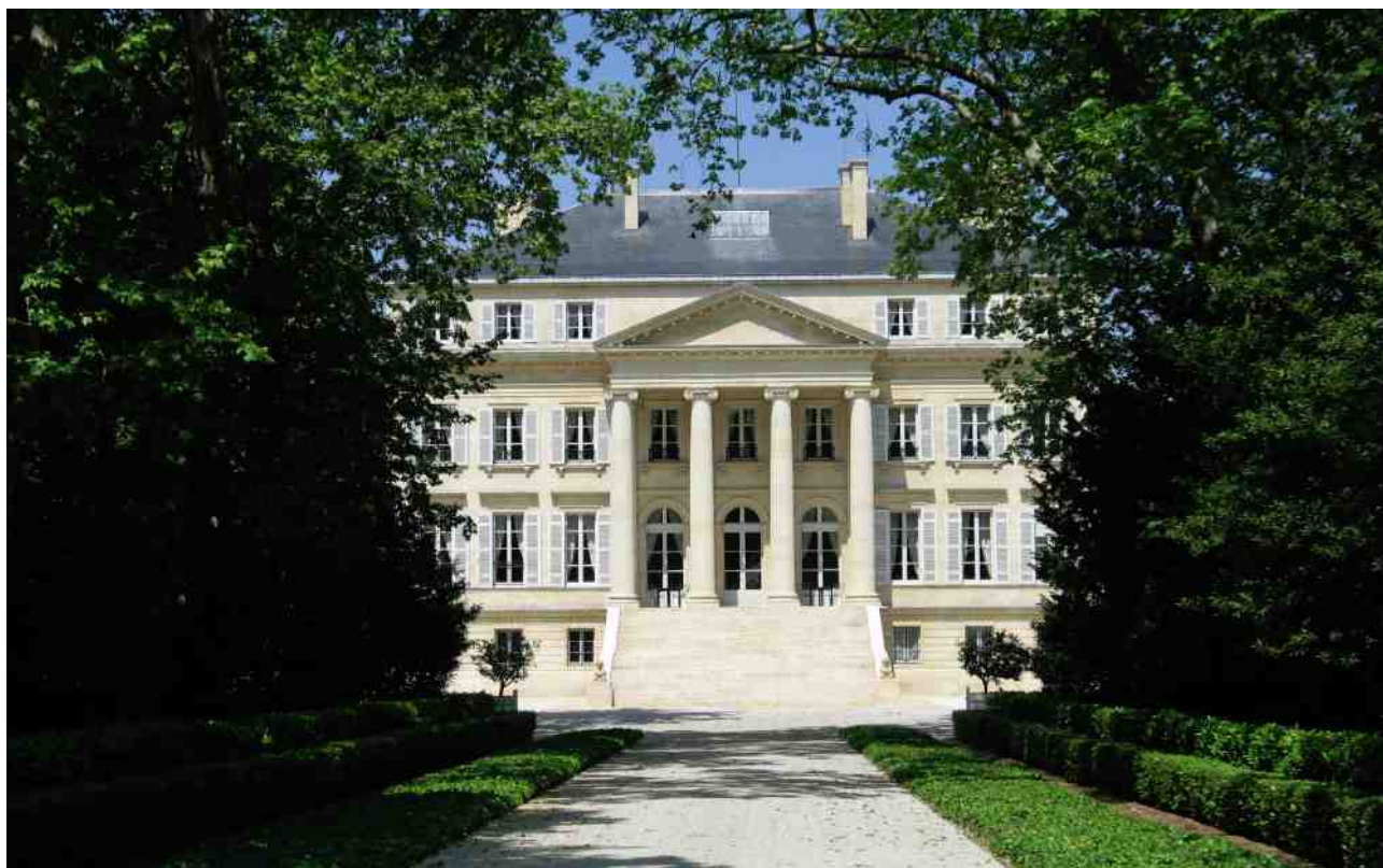
波爾多左岸頂級酒莊 Chateau Margaux，外觀非常優雅。

大中華地區很多葡萄酒愛好者，將波爾多視為優質產品代名詞，對該酒區情有獨鍾，因而令包括香港及澳門在內的中國市場，成為全球波爾多葡萄酒的最大出口地。