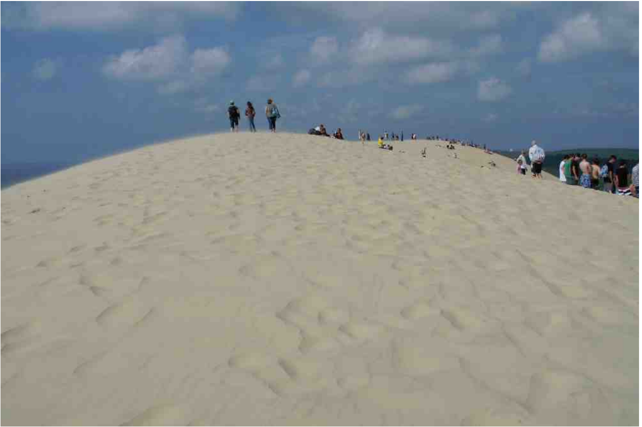
獨特海岸沙坵，自然吸引很多遊人。