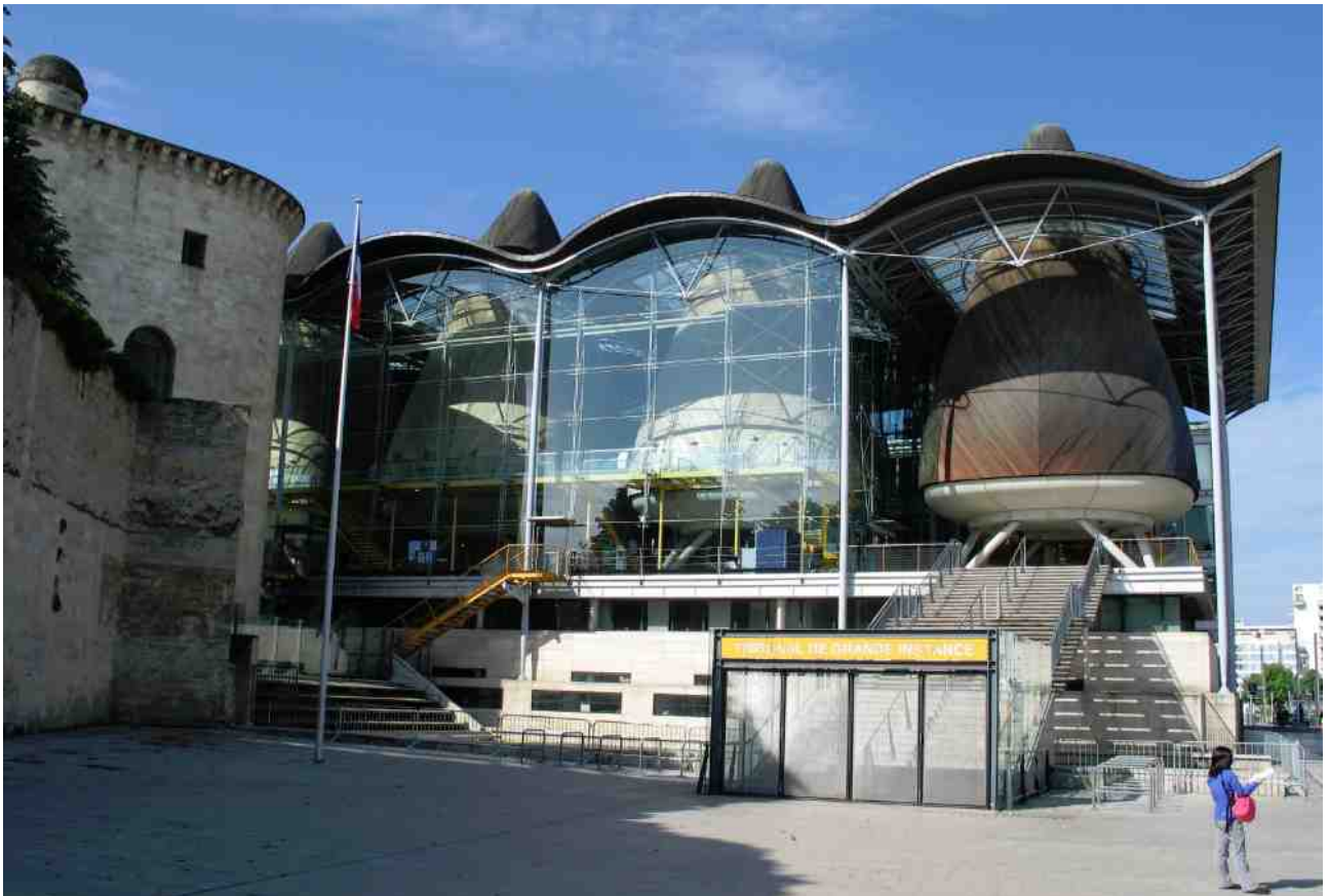
市內的法院也極具特色。