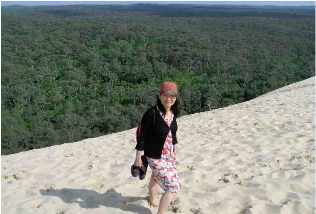
沙坵地帶接連一大片樹林，也起著保護作用。